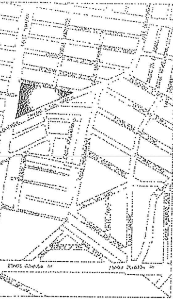
UBICACION SIN ESCALA

PROPIEDAD MUNICIPAL 2DA. Y SER. PLANTA A PLANTA BAJA CENDI